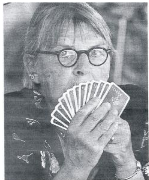
Konzentration ist auch beim Bridge die halbe Miete. Das komplizierte Kartenspiel erfordert von den Aktiven vor allem Aufmerksamkeit.